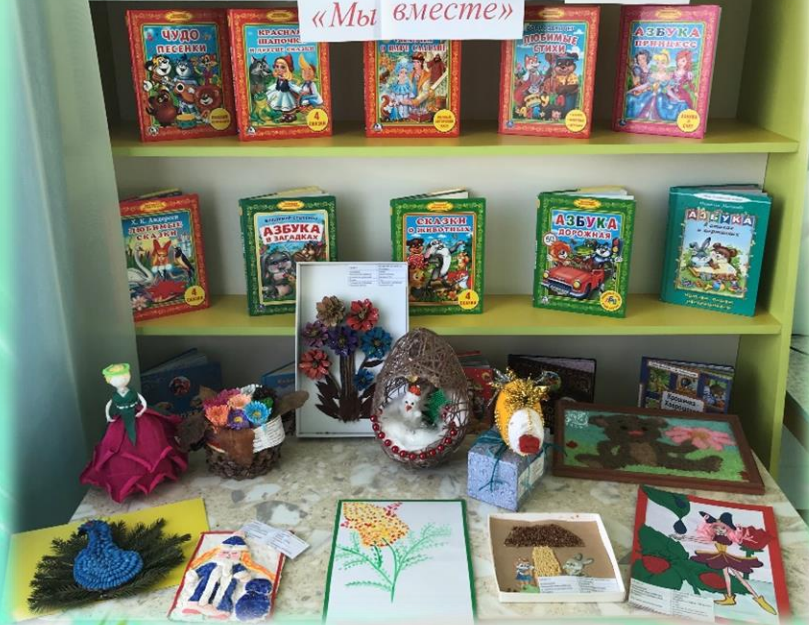
Выставка семейных творческих работ «Мы вместе»